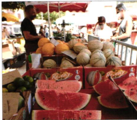
Verte dehors et rouge dedans, la pastèque n'occupe pas la place qui devrait lui revenir en tant que « meilleur fruit frais et désaltérant » dans ce torride été 2022.

sium et des protéines par ses graines, pour peu de calories : 38,9, malgré son goût sucré. Croquer dans ses tranches coupées en pyramide dans la tradition des pays méditerranéens ou la morceler et la mettre en alternance sur les brochettes de fruits frais.