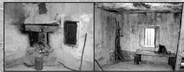
Bien que spartiate, l'intérieur n'en est pas moins chaleureux.

La restauration de l'intérieur est prévue, la mise en place d'un poêle à bois permettrait même d'en faire un "refuge" bien sympathique. D'autre part un projet de création d'une piste forestière pour l'exploitation des mélèzes et le reboisement est à l'étude à l'initiative de l'ONF. Sans desservir directement la cabane, cette piste permettrait un accès plus commode pour l'acheminement de matériel. Un problème subsiste : celui de l'eau ; en apparence il n'y a pas de source à proximité immédiate, mais ce n'est peut-être qu'une apparence ! Les anciens ne buvaient pas que du vin... alors, avis aux sourciers amateurs !